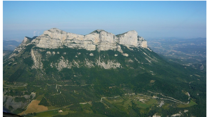
Col de la Chaudière et les Trois Becs