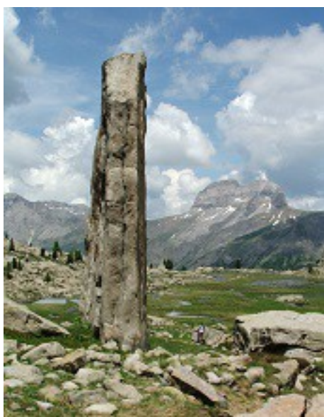
Les Eaux Tortes et la Grande Séolane

Pour cette première journée en Tinée nous ferons une belle boucle au-dessus de St Dalmas par les Crêtes de la Blanche. Puis ce sera une journée de relâche où nous irons passer un petit moment en Italie pour visiter et nous ballader autour du Sanctuaire de Santa Anna di Vinadio, à 2000 mètres d'altitude, juste de l'autre côté du Col de la Lombarde. Puis ce sera le départ du trek de 2 jours, en zone centrale du Parc National du Mercantour. Une magnifique boucle qui passera d'abord par le plus bel ensemble de lacs glaciaires des Alpes du Sud : les bucoliques Lacs de Vens. Après une nuit en refuge nous gagnerons la crête frontalière pour basculer sur un autre dédale de lacs glaciaires, plus discrets, plus sauvages, les Lacs de Morgon. Puis nous descendrons l'immense Salso Moreno et ses vastes alpages pour boucler ce qui, à mes yeux, représente la plus belle boucle de 2 jours des Alpes du Sud !!