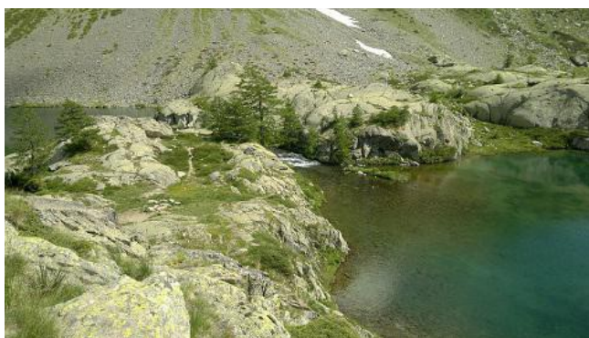
Lacs de Vens

Type de séjour : séjour rando semi-itinérant + trek de 2 jours (9 jours, 8 nuits, 7 jours de rando)