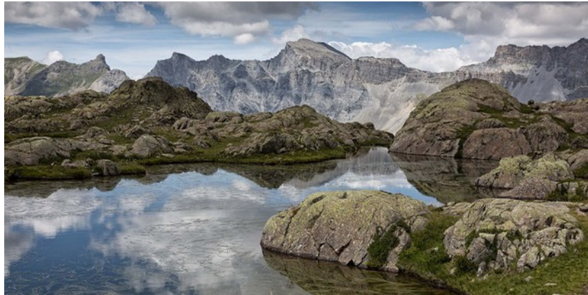
Lacs de Morgon et Pas de la Cavale