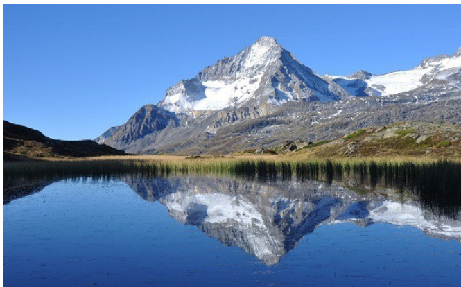
La Dent Parrachée

Type de séjour : séjour rando en étoile (8 jours, 7 nuits, 6 jours de rando)