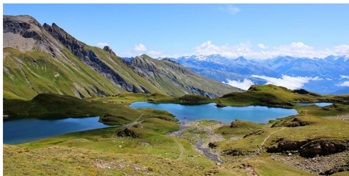
Cinq Lacs de la Forclaz

Option plus cool possible par la Combe de la Neuva 4h + 850m /- 160m Diff : 3/5 Repas et nuit au Refuge du Presset.